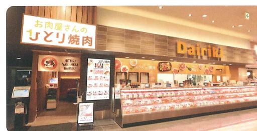
ダイリキイトーヨーカドー 八尾店

関西を中心に、東海・四国・中国地方で精肉店などを展開しているダイリキ株式会社が、「精肉店」と最近ブームになりつつある「ひとり焼肉」の複合という、新スタイルの事業をスタートしました。2020年9月に誕生した1号店の若江岩田店に続き、同年12月11日にはイトーヨーカ堂八尾店内に2号店をオープン。精肉店では、お肉を知り尽くしたプロが高い技術で店内カットした新鮮なお肉を販売。ひとり焼肉店では、上質なお肉の定食やホルモンの単品など豊富なメニューから選択。1席ずつパーティションで区切られた快適空間で、周囲を気にせず落ち着いて食べられます。しかもモバイルオーダーやセルフレジも取り入れているので安心。ランチに仕事帰りにと幅広く利用できそうなので、東大阪界隈へでかけた際に、ぜひ行ってみたいスポットが増えました。